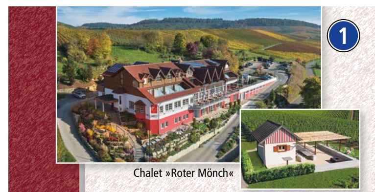
Chalet »Roter Mönch«